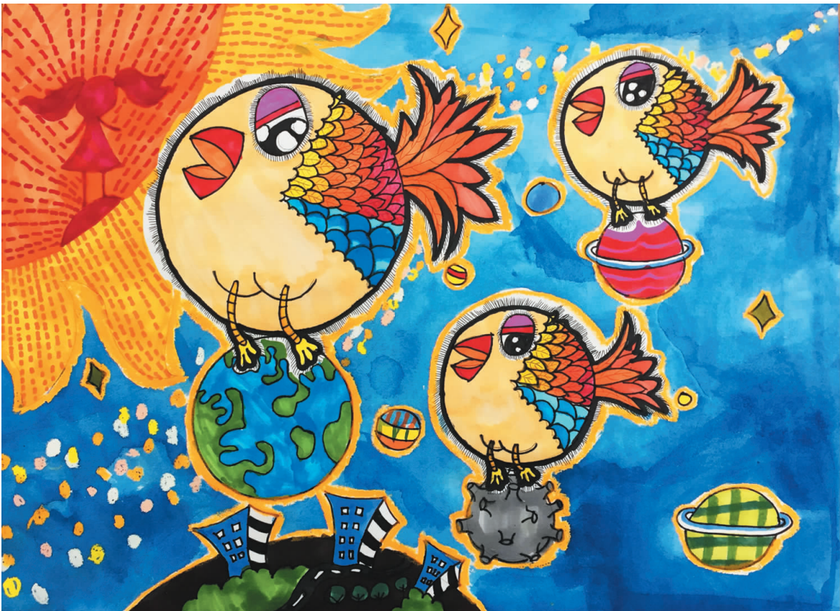
地球搬家 蓬街中心小学三(6)班 罗曼齐