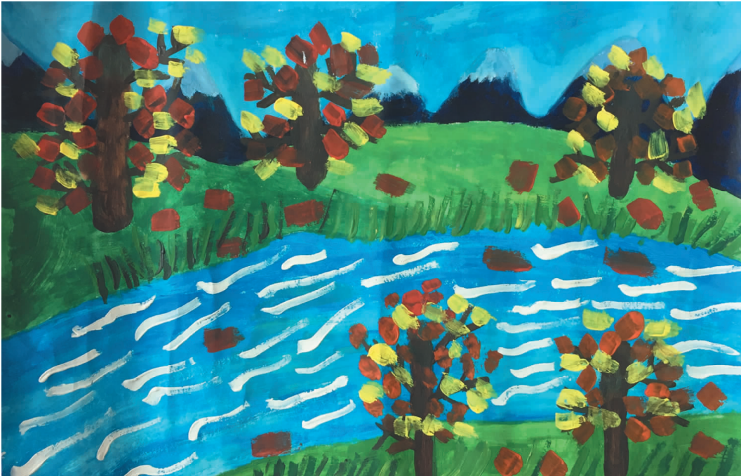
家乡蓝 蓬街私立小学三(二)班 阮铃铃 (指导老师 於安卡)