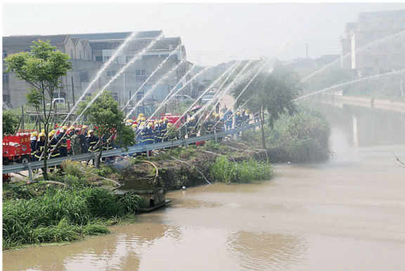
□本报通讯员 潘立志 周锦秀 文/摄