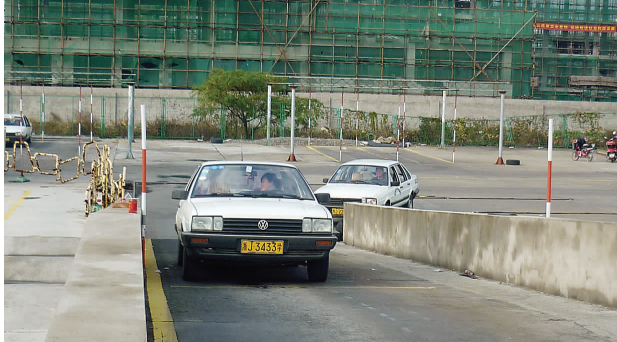
坡道定点停车与起步(必考)