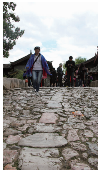
传说中的茶马古道