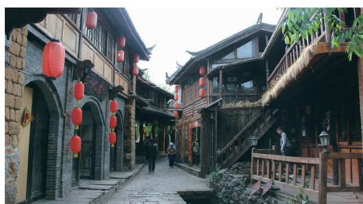
▲庭院深深 古城人家