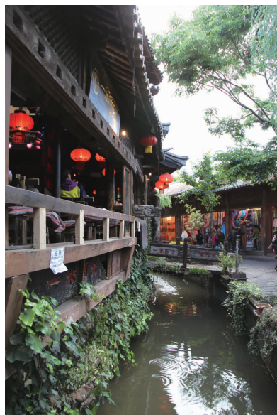
风情万种的酒吧一条街