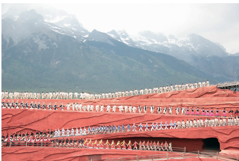
令人震撼的大型歌舞剧《印象丽江》