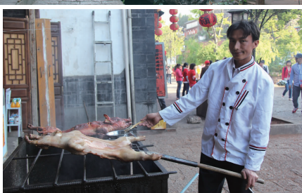
烤乳猪的东巴汉子