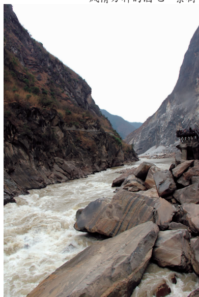
气势磅礴的虎跳峡