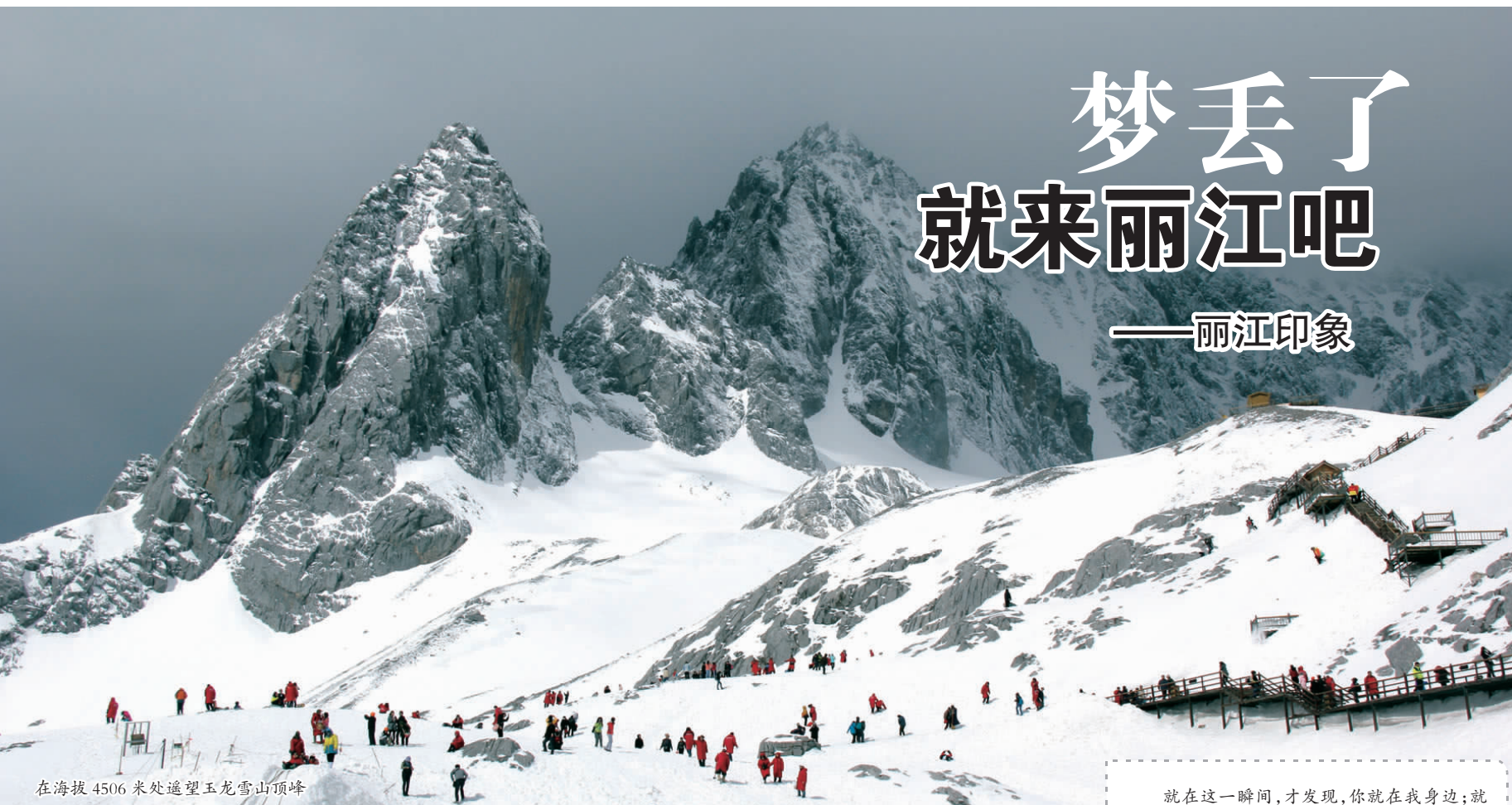
在海拔 4506 米处遥望玉龙雪山顶峰